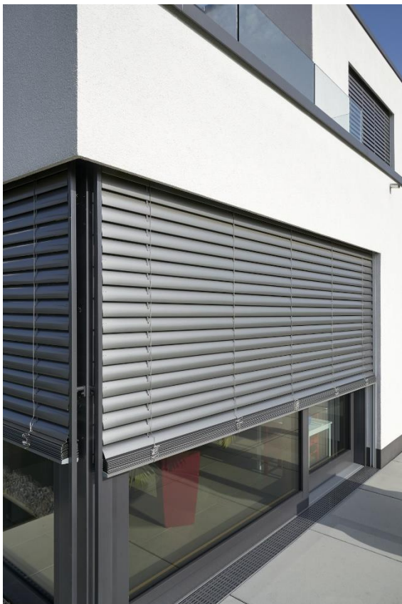
Bild 2: Neben den Kästen, Blenden und Führungsschienen können Alukon Partner auch die Raffstorelamellen aus eige-